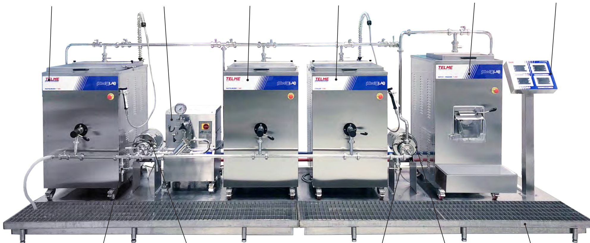
ZAWÓR SPUSTOWY DRAW OFF / DISCHARGE