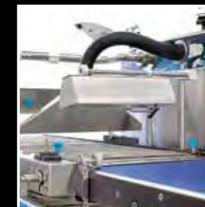
Pas transmisyjny Enrobing belt