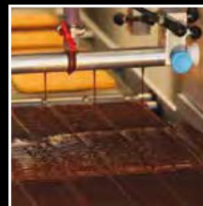
Moduł dekorujący Decorator