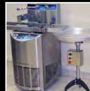
Pas transmisyjny do truflii Truffle belt