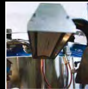
Lampa podgrzewająca pas transmisyjny Heating lamp belt