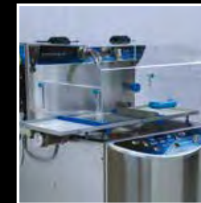
Oblona z tworzywa Plexiglass cover belt